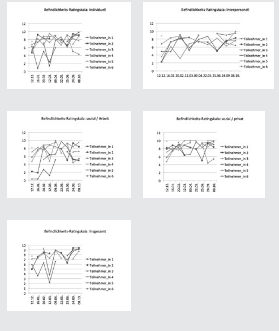
Abbildung 3: Fünf Grafiken zu Befindlichkeits-Ratingskala

Bezüglich der Resonanz der Teilnehmer_innen ist schwer einschätzbar, ob sich die insgesamt eher neutrale Einschätzung zwischen lästiger Pflicht und hilfreicher Standortbestimmung verbessern ließe, wenn wir als Leiter_innen noch aktiver mit den Bögen arbeiten würden.